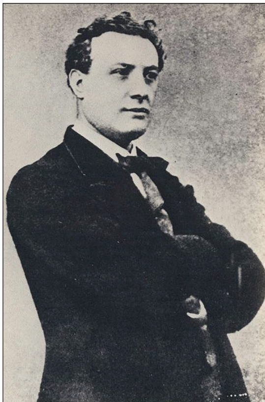
Figura 1. Jules Verne a 25 anys.

“Des que he arribat a París no han parat de donar-me diarrees, i això que vaig amb molt de compte. La nit passada vaig tenir uns vòmits molt forts, que, afortunadament, van passar. L’estómac comença a molestar-me bastant i no puc estar jugant amb la qualitat del que menjo. Amb sopars barats no aconseguiré calmar-lo i fer que deixi de queixar-se”. 10