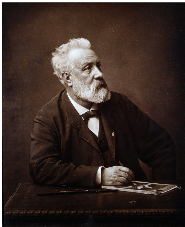
Figura 2. Jules Verne el 1892.

Els problemes gàstrics, que tant l'havien atribolat en la seva joventut, tornen aquests darrers anys, i esdevenen un tema freqüent a la seva correspondència. Així, el 8 de gener de 1897 escriu: “Avui començo de nou amb alguns rentats